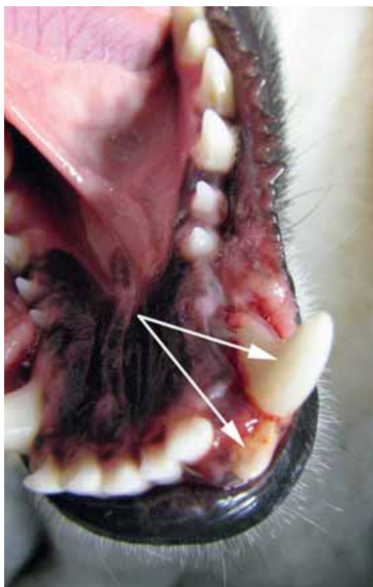
FIGURA 2 - Immagine clinica che evidenzia la dislocazione in senso laterale del terzo incisivo e del canino mandibolare di sinistra (freccie).