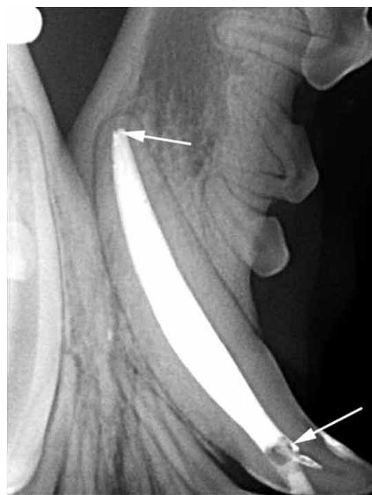
FIGURA 7 - Immagine radiografica ottenuta con tecnica intraorale obliqua al termine del trattamento endodontico del canino mandibolare di sinistra. Si evidenziano alcuni piccoli difetti di riempimento (freccie).