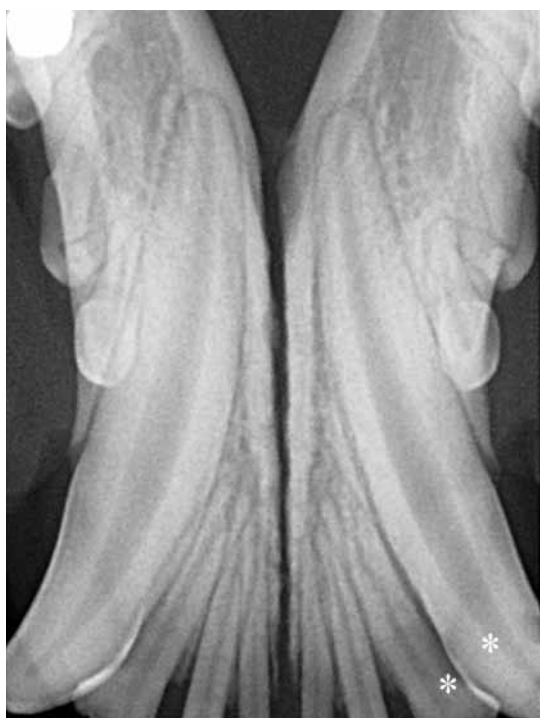
FIGURA 6 - Immagine radiografica intraorale della zona mandibolare rostrale alla rimozione dello splintaggio, a cinque settimane dal reimpianto. Asterischi: canino e terzo incisivo mandibolare di sinistra.

Il terzo incisivo reimpiantato non viene sottoposto a trattamento canalare considerando la possibilità di un danno vascolare limitato. Tuttavia, visto il rischio di necrosi pulpare, si informa il proprietario circa la necessità di eseguire ripetuti controlli radiografici. Nonostante si consigli il primo controllo a distanza di 6 mesi, il paziente viene rivalutato solo dopo circa un anno e mezzo dal trattamento, quando comunque non sono evidenziabili anomalie o lesioni periapicali (Figg. 8 e 9).