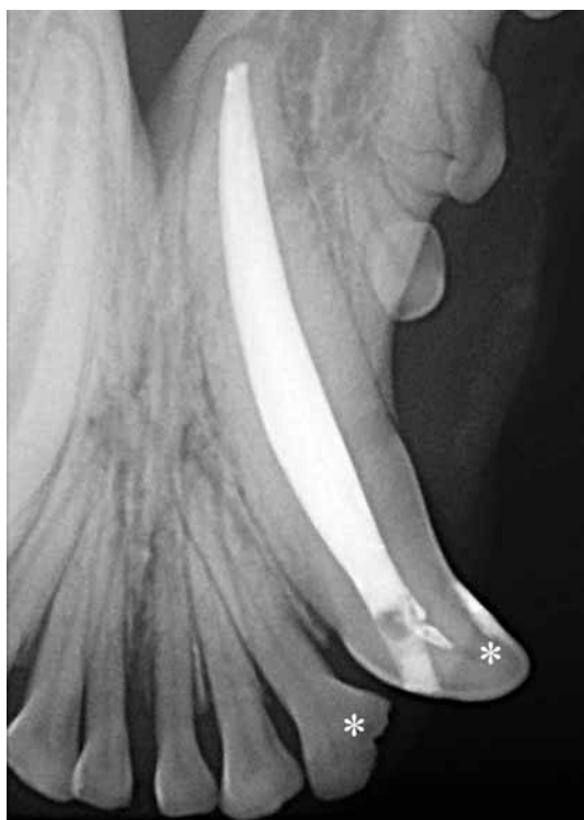
FIGURA 9 - Immagine radiografica intraorale dei denti trattati (asterischi) a 18 mesi dal reimpianto. Assenza di segni radiografici di lesioni endodontiche o parodontali, e di riassorbimento radicolare.

Durante la procedura di reimpianto occorre manipolare con delicatezza gli elementi dentali traumatizzati, le pareti alveolari ed i tessuti molli, al fine di evitare ulteriori danni alle cellule del legamento parodontale e conseguentemente pregiudicare il successo della terapia. Detriti e coaguli devono es-