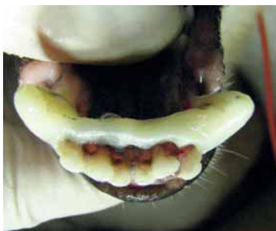
FIGURA 5 - Aspetto clinico della zona mandibolare rostrale dopo reimpianto e durante la fase di splintaggio.

manca di interferenza da parte dello splintaggio con la normale chiusura della cavità orale. Viene quindi prescritta una terapia postoperatoria con amoxicillina e acido clavulanico a 12,5 mg/kg ogni 12 ore, per via orale, per 15 giorni (Synulox, Pfizer) e carprofen a 2 mg/kg ogni 12 ore, per via orale, per 5 giorni (Rimadyl, Pfizer). Inoltre si raccomanda di alimentare il paziente solo con cibi di consistenza morbida e di eseguire lavaggi quotidiani della cavità orale con soluzione a base di clorexidina digluconato allo 0,12%. A distanza di 1 e 3 settimane dall'intervento si eseguono delle visite