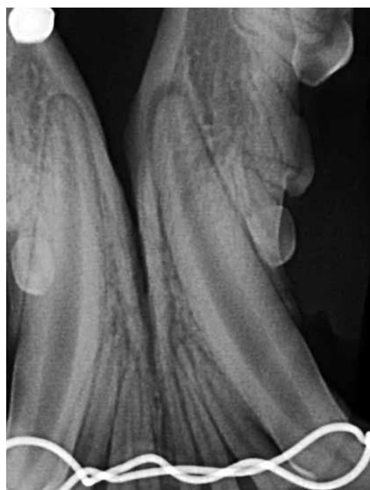
FIGURA 4 - Immagine radiografica intraorale della zona mandibolare rostrale dopo reimpianto e cerchiaggio dei denti dislocati.

Terminata la procedura e prima di risvegliare il paziente viene eseguito un ulteriore controllo radiografico a conferma del preciso riposizionamento dei denti, della normale occlusione dentale e della