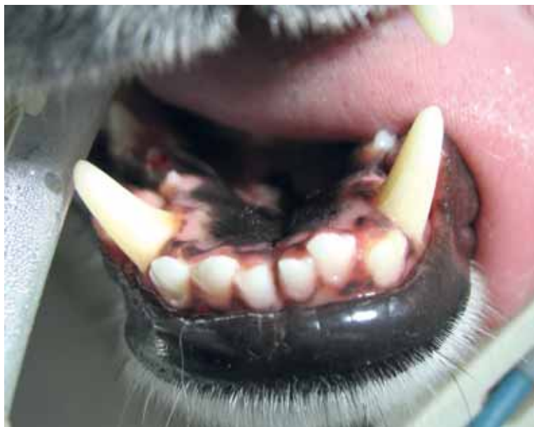
FIGURA 8 - Aspetto clinico della zona mandibolare rostrale a 18 mesi dal reimpianto. Si nota una lieve deviazione del canino reimplantato in senso vestibolare e dell'incisivo in senso vestibolare.

Le molecole di prima scelta sono l'amoxicillina e la tetraciclina. Nel caso descritto il trattamento è stato iniziato in sede intraoperatoria e, considerando un alto rischio di infezione batterica, è stato continuato per 15 giorni.