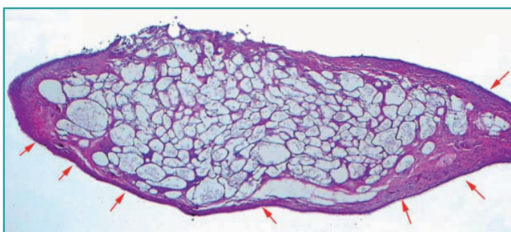
Figura 2 - Campione istologico di congiuntiva, piccolo ingrandimento (4x): al di sotto di un epitelio congiuntivale integro (freccie rosse) il corion è diffusamente espanso dalla presenza di ampi vacuoli di differenti dimensioni, a contenuto otticamente vuoto o rappresentato da scarsi residui granulari.