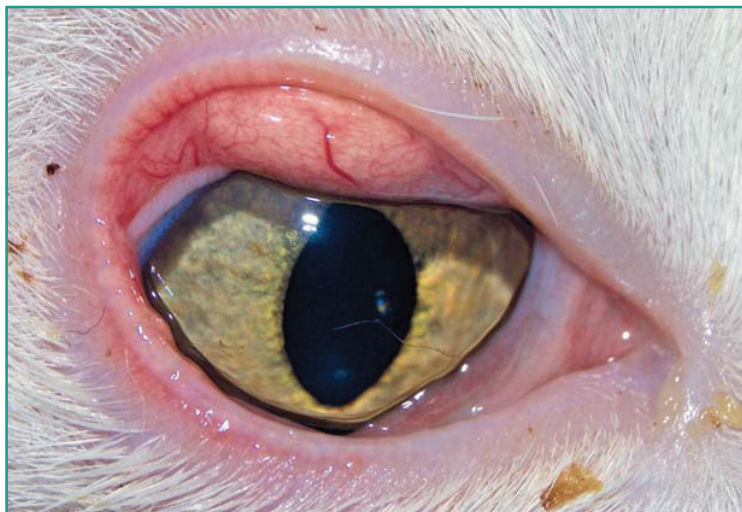
Figura 3 - Dettaglio della neoformazione congiuntivale superiore.

La rimozione chirurgica delle formazioni granulomatose è curativa nei casi in cui causano irritazione.