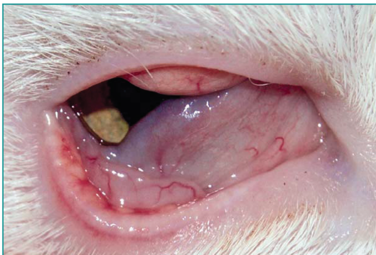
Figura 1 - Neoformazione congiuntivale di circa 5 mm in prossimità del margine palpebrale superiore e piccole neoformazioni in prossimità del margine palpebrale inferiore.