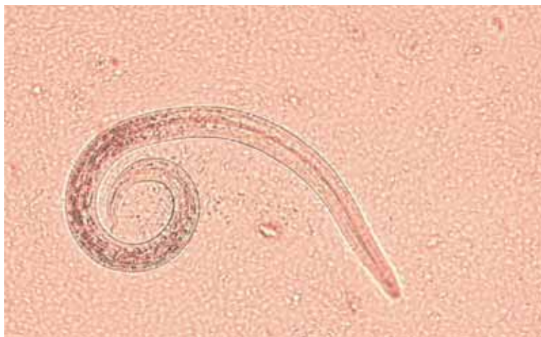
FIGURA 1 - Larva di primo stadio di Aelurostrongylus abstrusus .