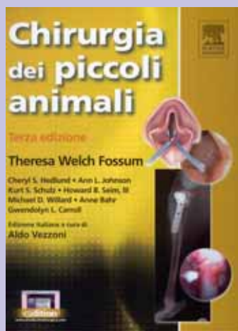
FOSSUM Chirurgia dei Piccoli Animali 3/ed. 2008 Elsevier-Masson listino € 220,00 scontato € 187,00