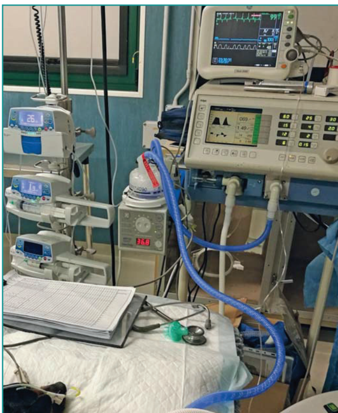
Figura 3 - Paziente con ventilazione SIMV+PSV in terapia intensiva.

1) La prima diagnosi differenziale è una patologia del motoneurone inferiore acuta ( Lower Motor Neuron Disease - LMND). Le cause riconosciute di LMND nel cane sono la poliradiculoneurite acuta, il botulismo, la paralisi da zecche e la miastenia gravis . Altre cause sospette sembrano essere polmiositi, polineuropatie, grave ipokaliemia ed alcune intossicazioni (es. organofosforici, antiaritmici, aminoglicosidi) 1,2 .