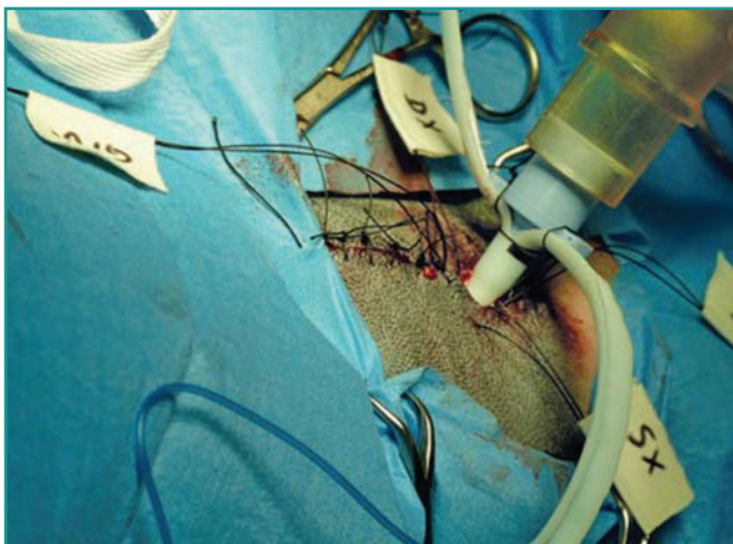
Figura 2 - Tracheostomia utile per la ventilazione assistita a paziente sveglio.