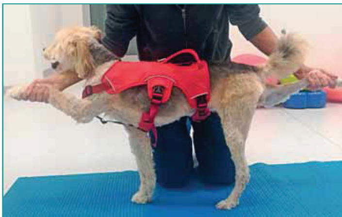
Figura 5 - Posizionamento con appoggio per bipede diagonale ("Snoopies position").

La ripresa dell'attività fisica prevede un'adeguata fase pre-allenamento ( warmup ), attività fisiche poco impegnative e un corretto monitoraggio e raffreddamento ( cooldown ).