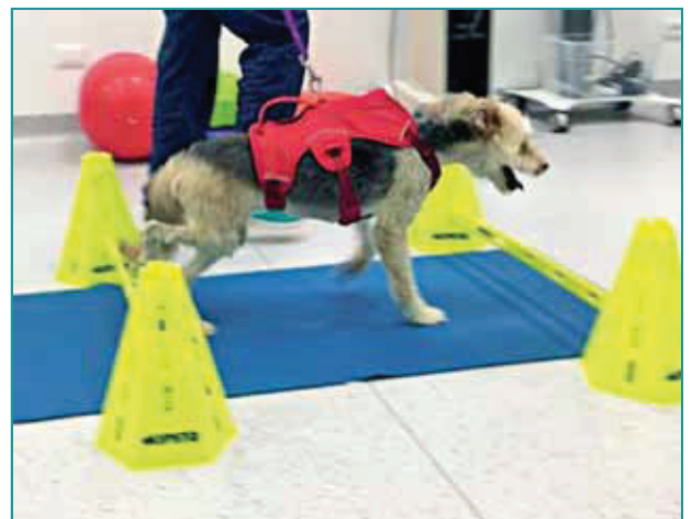
Figura 6 - Passeggiata su ostacoli bassi e distanza regolare.

In caso di lesioni croniche l'utilizzo di antiinfiammatori non steroidei è spesso inefficace e sconsigliato, considerata la finalità terapeutica di favorire una riacutizzazione del processo infiammatorio locale, che permetta un ri-