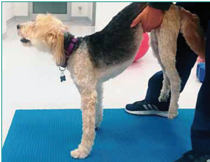
Figura 3 - Posizionamento in stazione con appoggio sul bipede anteriore.