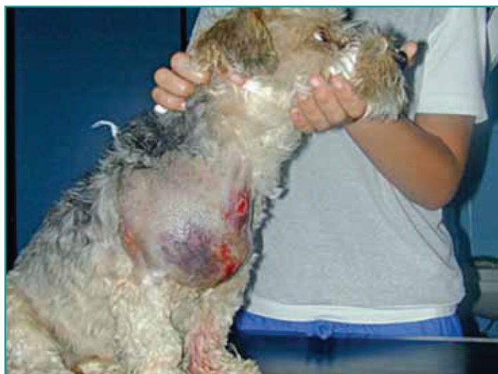
Figura 1 - Cane Yorkshire maschio anni 5. Trauma muscolare di grado III (grave) coinvolgente i muscoli pettorali e la regione della spalla destra.

La fase di guarigione necessita un perfetto equilibrio tra processo di rigenerazione e processo di cicatrizzazione, al fine di limitare l'estendersi della componente fibrosa.