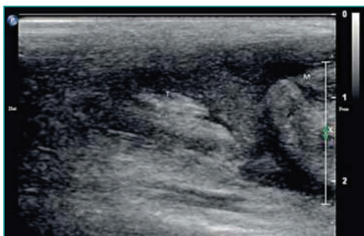
Figura 2 - Immagine ecografica relativa al distacco tendineo dalla giunzione muscolo-tendinea del capo laterale del muscolo gastrocnemio. Dist = distale; Prox = prossimale; T = tendine; M = ventre muscolare.

All'esame ecografico il tessuto muscolare si presenta, in scansione longitudinale, diffusamente ipocogeno e intervallato da strutture lineari oblique iperecogene, legate alla componente connettivale (perimisio) e circondato da un'interfaccia iperecogena rappresentata dall'epimisio. In scansione trasversale i muscoli appaiono ipocogeni con disseminati spot iperecogeni ascrivibili alla componente connettivale 23,24,25 . In corso di lesioni acute l'aspetto ecografico del muscolo varia notevolmente e si possono osservare: aumento di volume del ventre muscolare e aree disomogenee ipo- e/o iperecogene dovute a edema, infiammazione ed emorragie, abbondante versamento ipocogeno disomogeneo in presenza di distacco