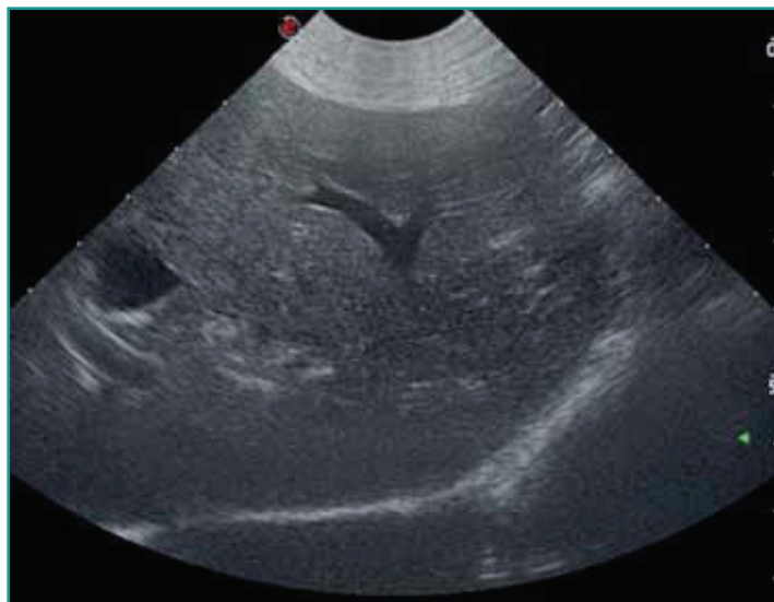
Figura 1 - Immagine ecografica: Fegato a margini regolari, normodimensionato, valutato soggettivamente ipoecogeno ed omogeneo. Colecisti distesa, con parete di normale spessore e contenuto anecogeno. Vie biliari extraepatiche normali, intraepatiche non evidenziabili. Si rileva moderato aumento del disegno vascolare portale.

Le alterazioni biochimiche evidenziavano la presenza di epatopatia; poliuria e polidipsia potevano essere giustificate dall'infezione delle vie urinarie o da una condizione di insufficienza epatica indagata tramite misurazione degli acidi biliari pre e post prandiali e del profilo coagulativo (Tabella 1). Si è quindi proceduto con ecografia addominale, citologia epatica e, in seguito, biopsia epatica ecoguidata tramite tru-cut.