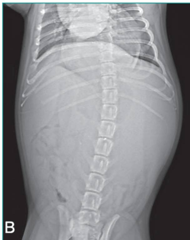
Figura 1 - Proiezione latero-laterale (A) e dorso-ventrale (B) del paziente durante la visita clinica.