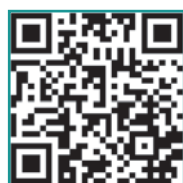
Video 1: Video intra-operatorio della riduzione degli organi erniati. https://www.scivac.it/it/v/21556/1

In questo caso, oltre alle due tecniche su tre previste per la risoluzione dell'ernia iatale, è stata effettuata una gastropessi pilorica (destra), considerato il moderato grado di dislocamento del piloro e del duodeno in senso craniomediale. Solitamente la doppia gastropessi si effettua in corso di intussuscezione gastro-esofagea