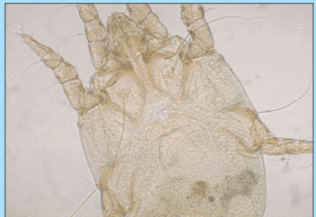
FIGURA 4 - Femmina adulta di Otodectes cynotis (40X).