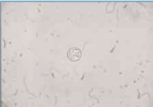
FIGURA 2 - Oocisti sporulata di Eimeria furonis in cui sono visibili le sporocisti e gli sporozoit (100X).